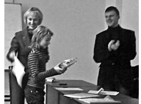
Наймолодша учасниця конкурсу отримує нагороду

Конкурсанти заочно виконували роботу та вислали їх електронною поштою для рецензування викладачам ІКНІ. Наприкінці року відбувся захист робіт учасників. Переможцем став колектив учнів Львівської академічної гімназії з роботою „Нейромережеві засоби штучного інтелекту для розв'язання задач“. Друге місце посів вихованець Прикарпатського військово-спортивного ліцею-інтернату за розроблену програму тестування знань із інформатики та сайт ліцею. Третє місце виборов учень Новояворівського ліцею