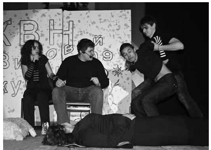
Доісторична „аська“ (команда ІХХТ „P. S.“)