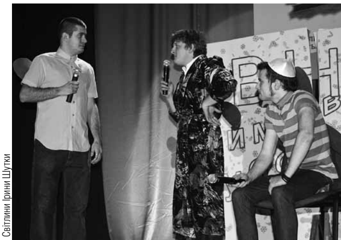
Родина Карлсонів (команда ІГДГ „5×1,70 м“)